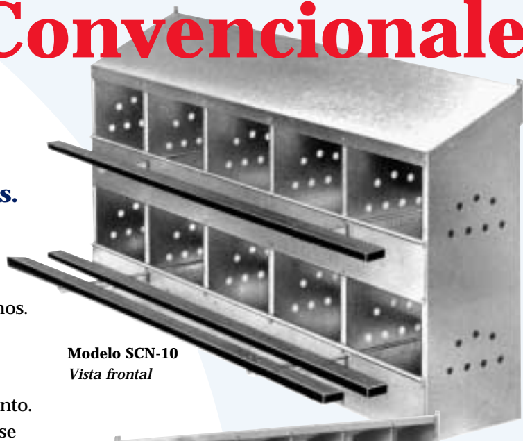
Modelo SCN-10 Vista frontal